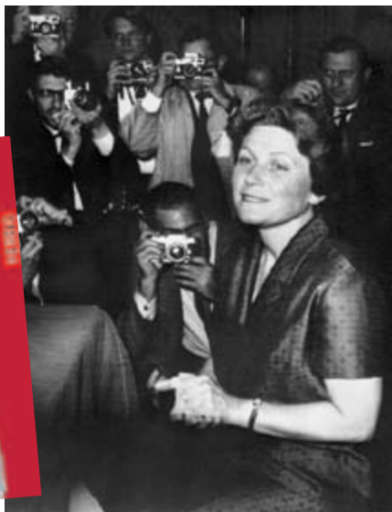
Swetlana Allilujewa, nach ihrer Ankunft in den USA, 1967